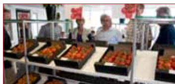
House Fair 2010